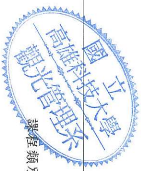
觀光管理系觀光餐旅管理碩士班 112學年度入學課程結構規劃表