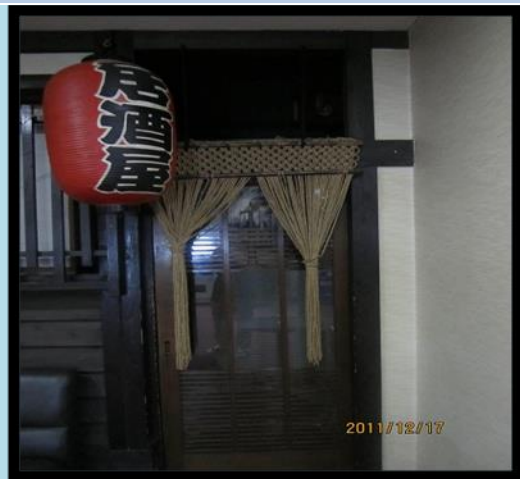
圖 11 居酒屋