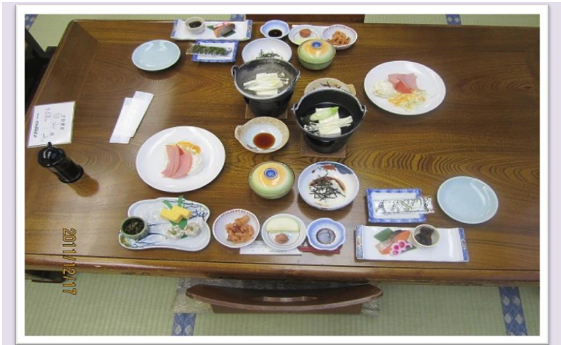
圖 17 B食早餐