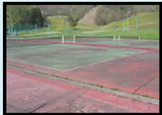
圖 14 網球場