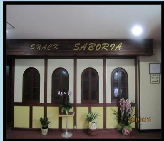
圖 12 pub