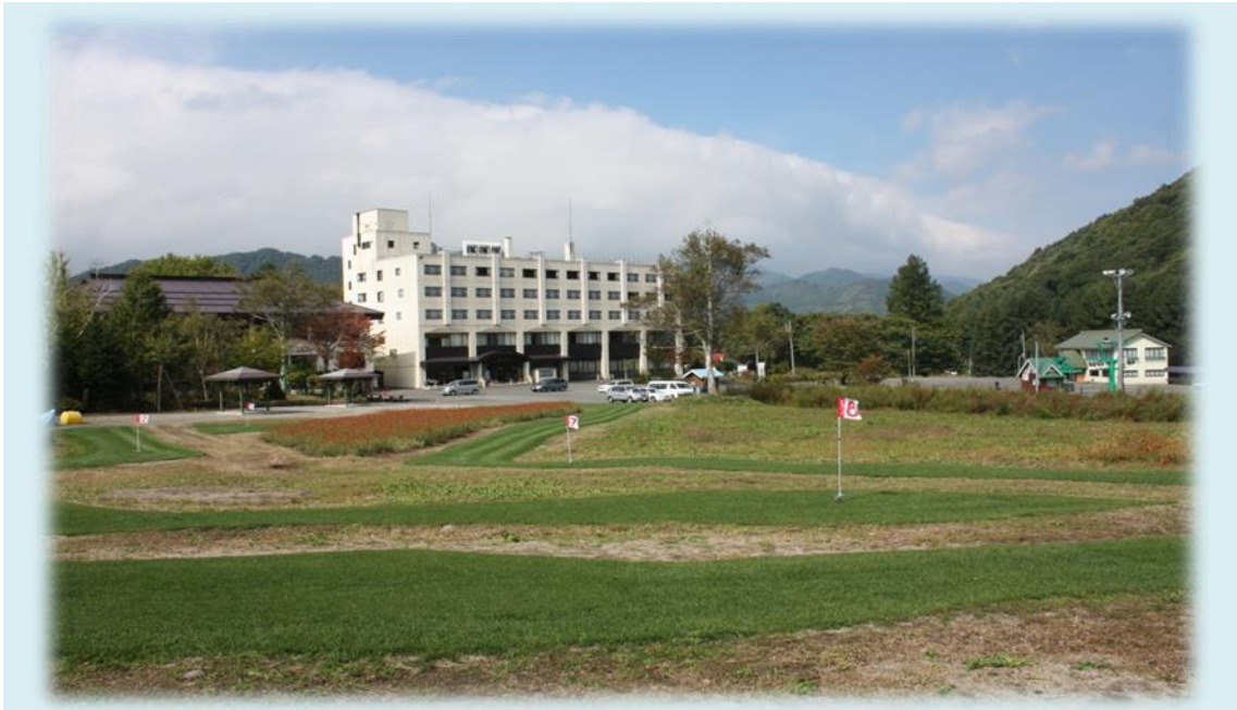
圖 15 高爾夫球場