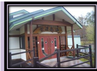
圖 7 個人湯屋