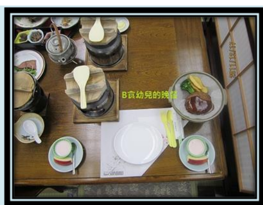
圖 22 B食幼兒晚餐