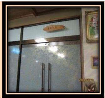
圖 6 白樺之間