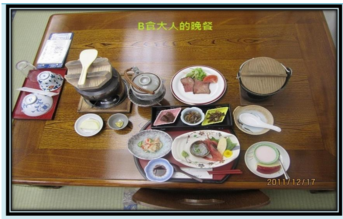
圖 20 B食大人晚餐