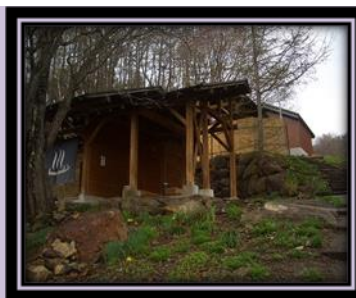
圖 8 百景花