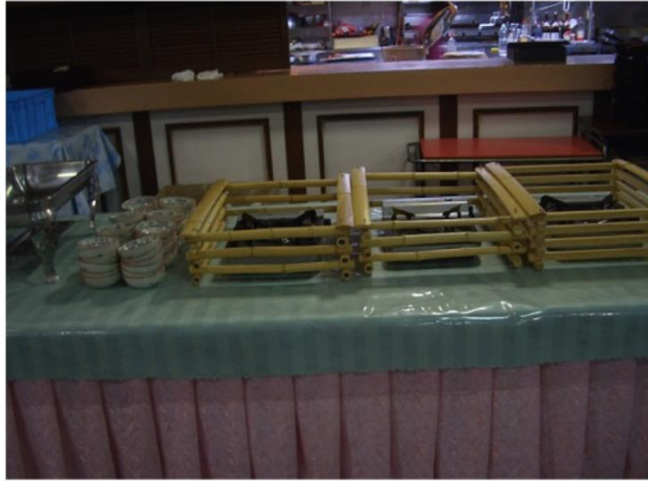
圖 19 自助餐