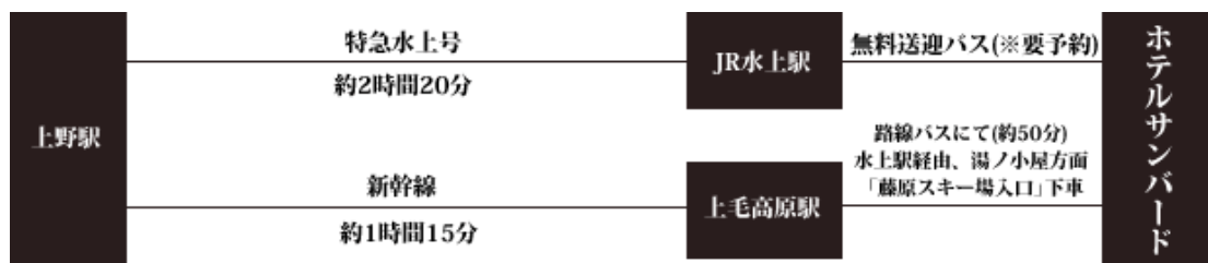
圖 3 大眾交通工具路線