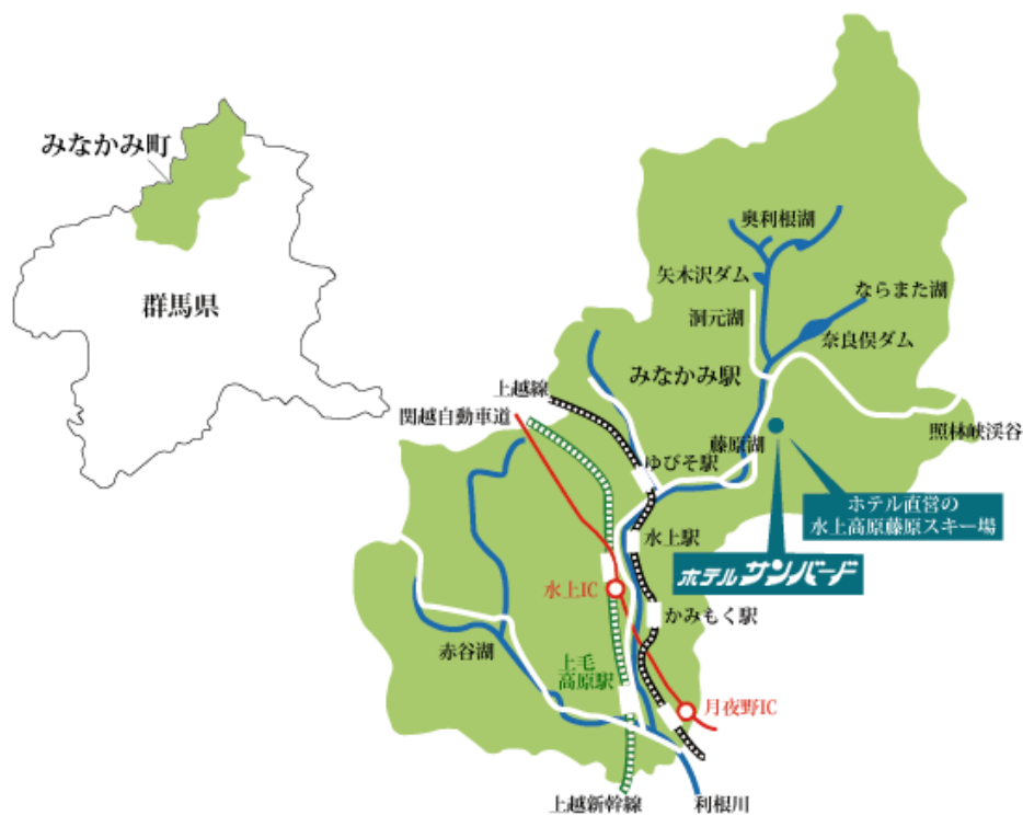
圖 1 飯店地圖