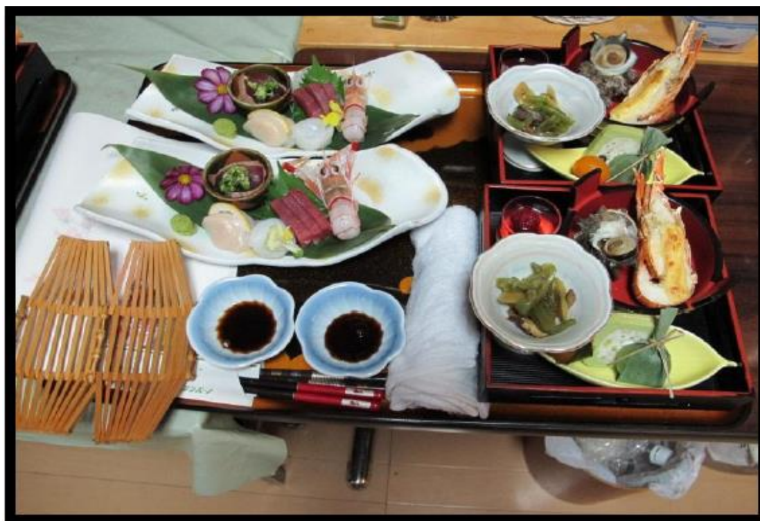
圖 23 C食晚餐