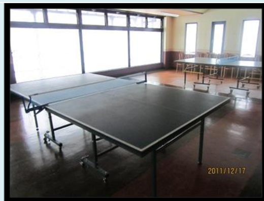
圖 13 桌球間