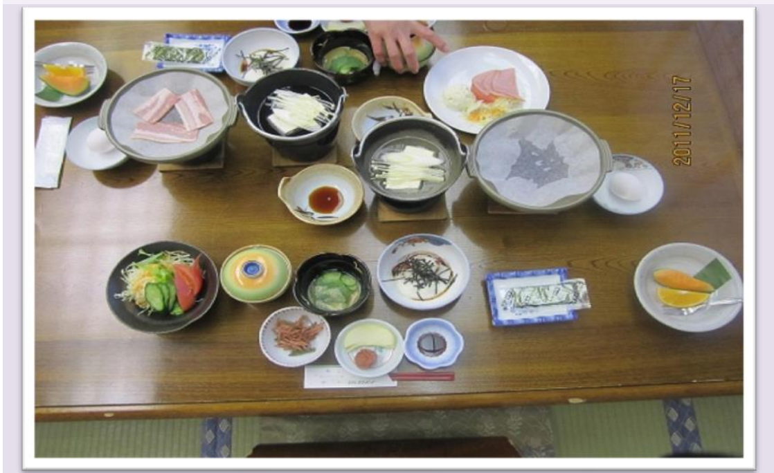
圖 18 C食早餐