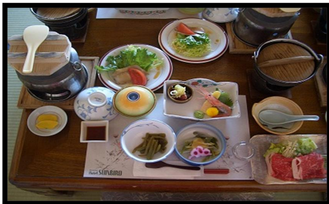
圖 24 宴會