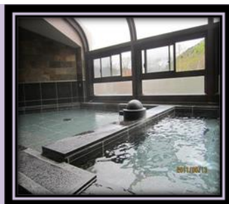
圖 9 大浴場