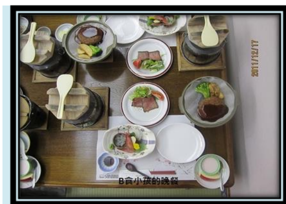
圖 21 B食小孩晚餐