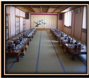
圖 5 大廣間