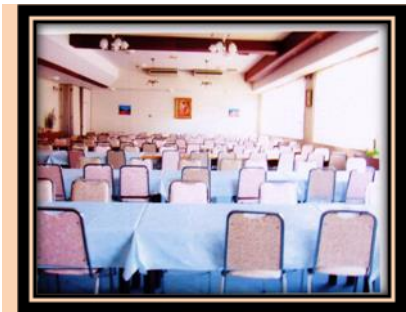
圖 4 一樓餐廳