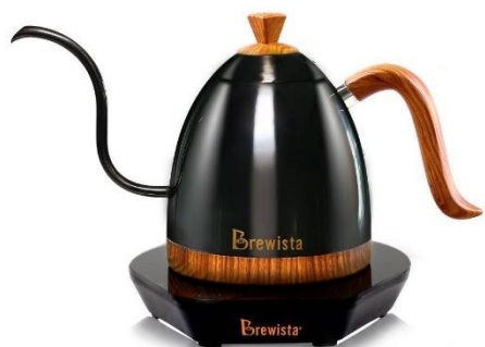
附圖一(Brewista Artisan 600ml 溫控壺)