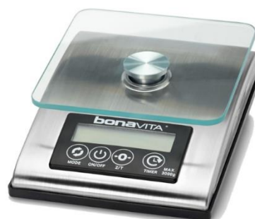
附圖二(bonavita 3kg 精密電子秤)