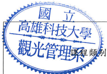
觀光管理系 進四技 109 學年度入學課程結構規劃表