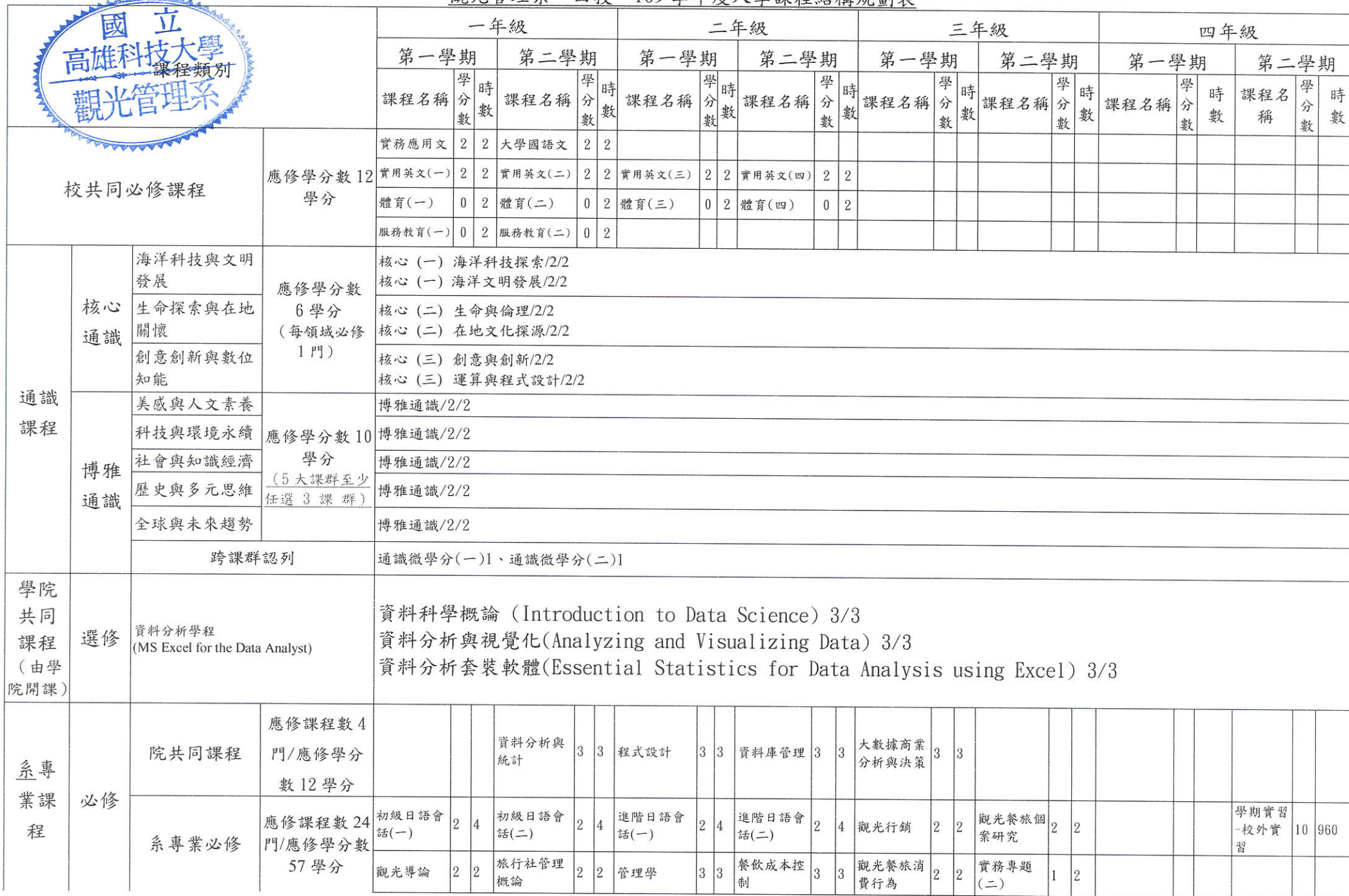
觀光管理系 四技 109 學年度入學課程結構規劃表