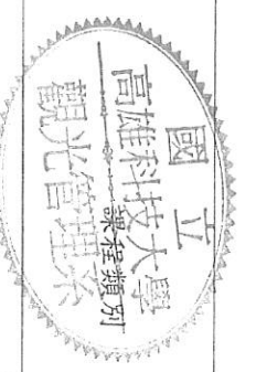
觀光管理系 四技 108 學年度入學課程結構規劃表