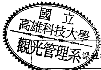
觀光管理系 進碩士班 108 學年度入學課程結構規劃表