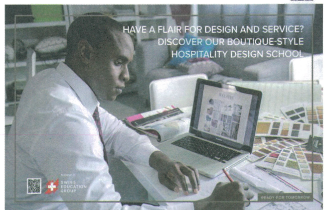
IHTTI 飯店管理設計大學