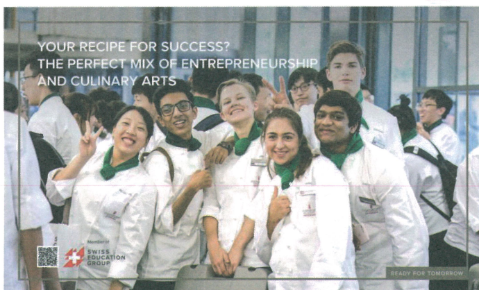
CAA 廚藝美食管理大學