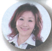
SHMS瑞士旅館管理大學 台灣區代表