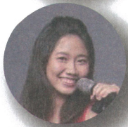
SEG教育集團 台灣區校友會會長